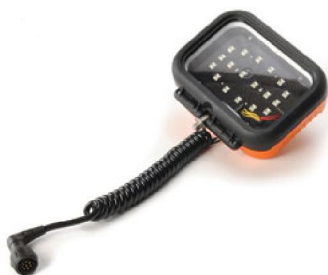
Painel de LED com conexão para bateria 12V