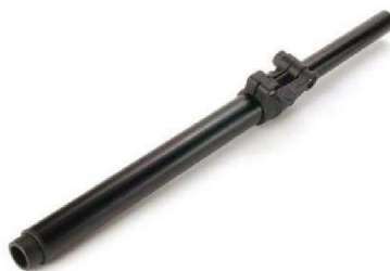
Suporte p/ painel com ajuste de altura