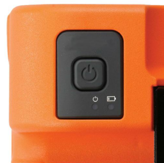
Indicador de nível de bateria